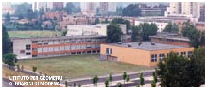
L'ISTITUTO PER GEOMETRI G. GUARINI DI MODENA